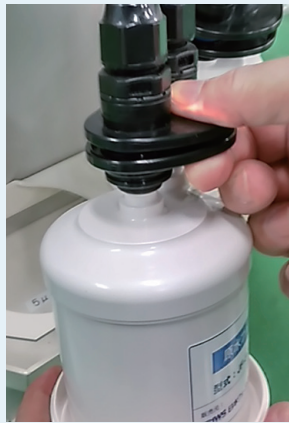
ワンタッチで交換可能